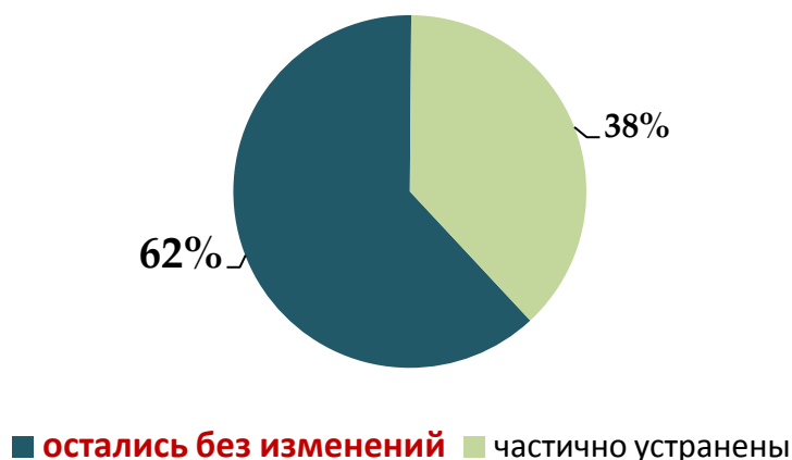
Рис 4. Устранение очевидных ошибок сводного отчета после ПК

В рамках Мониторинга стадии 2 мы рассматривали все размещенные сводные отчеты на предмет наличия в них очевидных недочетов. Вполне естественно, что выявленные нами ошибки не являются прямым руководством разработчикам к действию. Вместе с тем, поскольку ошибки именно очевидные, например, незаполнение каких-то разделов сводного отчета или явная подмена информации в подразделах, то, казалось бы, представляя сводный отчет в пакете с текстом проекта акта и другими документами для заключения в Минэкономразвития России, ведомство могло бы и исправить недочеты, повысив свои шансы в получении положительного ЗОРВ, по крайней мере в процедурных моментах. В рамках настоящего мониторинга мы осуществляем сопоставление с финальной версией сводного отчета по тем проектам актов, которые получили заключение. Такие сводные отчеты размещаются на портале, и финальными мы их называем в том смысле, что данный отчет и является тем документом, который направлен в Минэкономразвития России, а о какой-то его последующей доработке ничего неизвестно ввиду того, что уточненные версии затем на портал не помещаются. Следует отметить, что доля неисправлений практически не изменилась и как была высокой, так и остается.