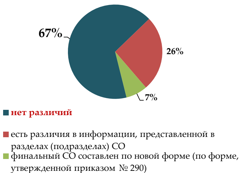
Рис 2. Наличие различий в СО, размещаемых для ПК, и финальной версией

Возникли сложности с определением характера размещенных ЗОРВ. Дело в том, что на портале предусмотрено специальное поле, в котором Минэкономразвития России должно указывать положительное или отрицательное заключение по проекту акта. Однако выяснилось, что в паспорте проекта на данной стадии может быть не указан характер ЗОРВ, в таких случаях приходится обращаться непосредственно к тексту заключения, но из него не всегда однозначно можно составить мнение о его характере (и в некоторых случаях, хотя и единичных, приходится говорить о том, что заключение преимущественно положительное или преимущественно отрицательное) Следует отметить, что в данном раунде количество проектов, по которым не указан характер заключений в паспорте, сократилось.