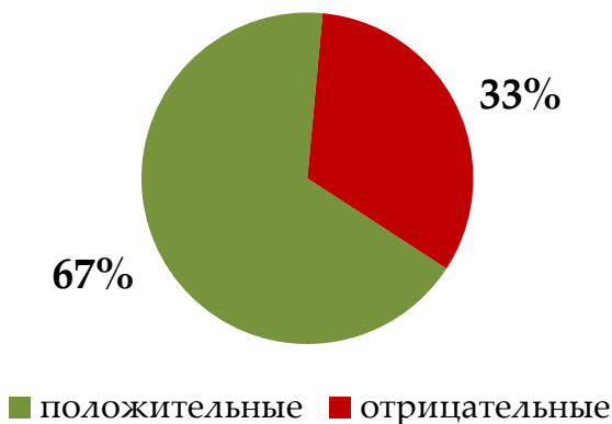
Рис 3. Характер заключений об оценке регулирующего воздействия

Возникли сложности с определением характера размещенных ЗОРВ. Дело в том, что на портале предусмотрено специальное поле, в котором Минэкономразвития России должно указывать положительное или отрицательное заключение по проекту акта. Однако выяснилось, что в паспорте проекта на данной стадии может быть не указан характер ЗОРВ, в таких случаях приходится обращаться непосредственно к тексту заключения, но из него не всегда однозначно можно составить мнение о его характере (и в некоторых случаях, хотя и единичных, приходится говорить о том, что заключение преимущественно положительное или преимущественно отрицательное) Следует отметить, что в данном раунде количество проектов, по которым не указан характер заключений в паспорте, сократилось.